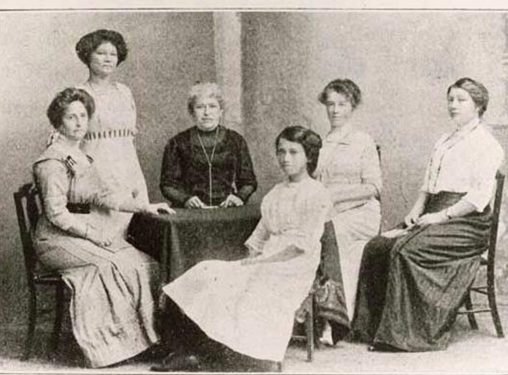
HET BESTUUR VAN S O. V. I. A.