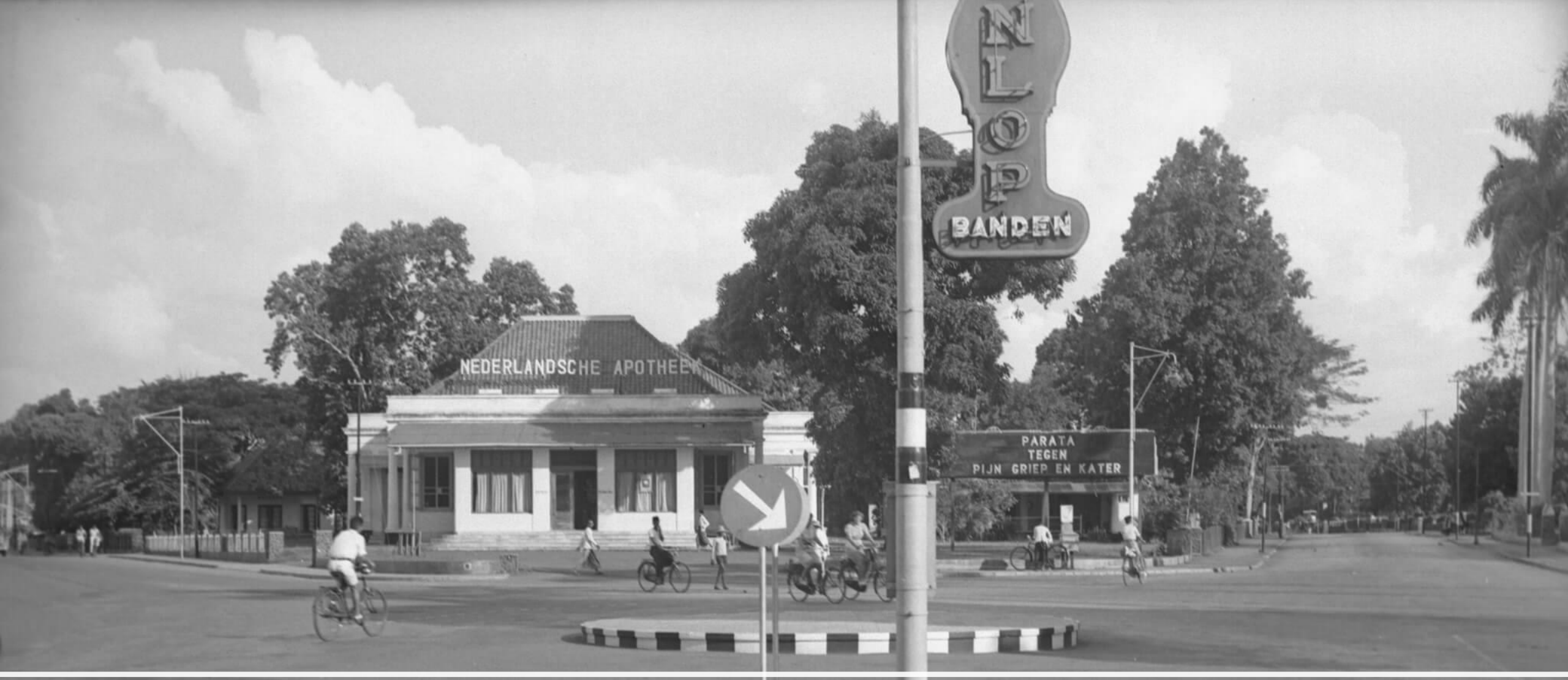
De Nederlandsche Apotheek in 1930