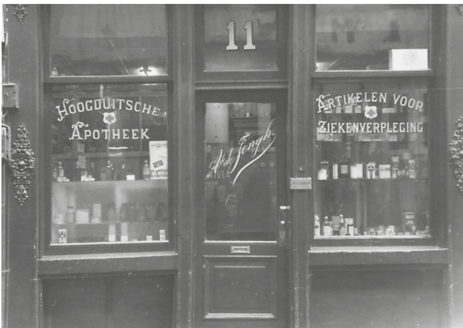
De recepten zijn afkomstig uit de Hoogduitsche Apotheek Ads de Jongh, gevestigd op de Oude Hoogstraat in Amsterdam, nabij de oude Joodse buurt rond de Nieuwmarkt en het Waterlooplein.

De collectie omvat 577 recepten van 36 Joodse artsen, onder wie 23 huisartsen en 13 specialisten. Van de recepten uit 1942 zijn 494 uitgeschreven door huisartsen en 83 door specialisten. Opvallend is het grote aantal dermatologische middelen zoals zalven, lotions en verbandwaters, vermoedelijk als gevolg van de slechte woonomstandigheden in de Joodse buurt. Daarnaast werden veel maagpoeders, kalmeringsmiddelen, ijzerdrankjes en APC-poeders voorgeschreven, wat wijst op stress-gerelateerde klachten en slechte voedingsomstandigheden. Alle 577 recepten zijn gedigitaliseerd en opgeslagen. De identiteit en biografie van de artsen en patiënten zijn gere-