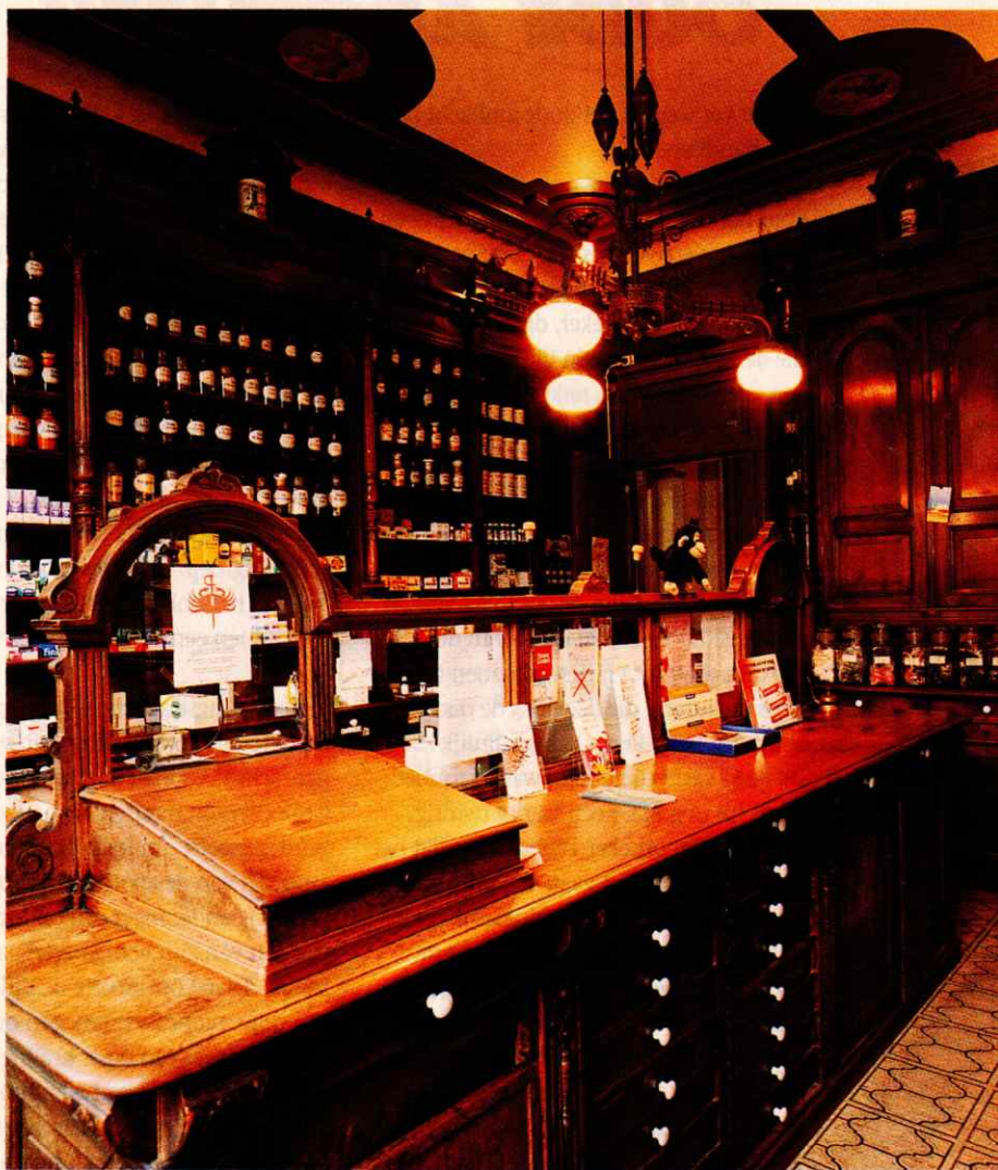
Rotterdams oudste apotheek.

die toegang verschaft tot de apotheek. Een ruimte die even klein (of groot) is als een flinke woonkamer. Twee antieke leren banken die een zitplaats bieden aan maximaal zes cliënten, flankeren het middenpad, dat zeker niet groter is dan twee vierkante meter. De notenhouten balie is in het midden afgewerkt met mat melkglas, erboven hangt een drie-armige lamp, met gemarmerde lampekappen. Slap hangende kettingen markeren de ruimten die alleen voor personeel en apotheker bestemd zijn. De moderne tijd >>